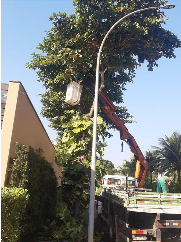
Poda sendo realizada com auxílio do caminhão munck.