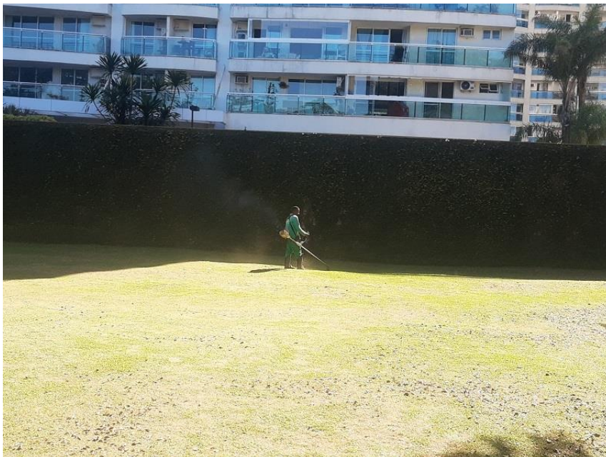
Operador de roçadeira realizando corte de grama.