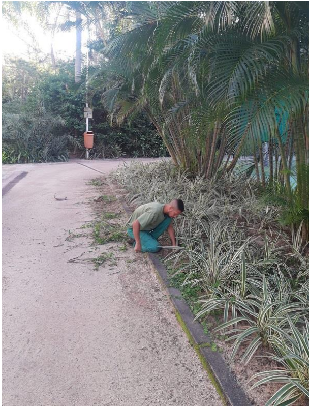
Monda (Remoção de Plantas Daninhas) sendo realizado.