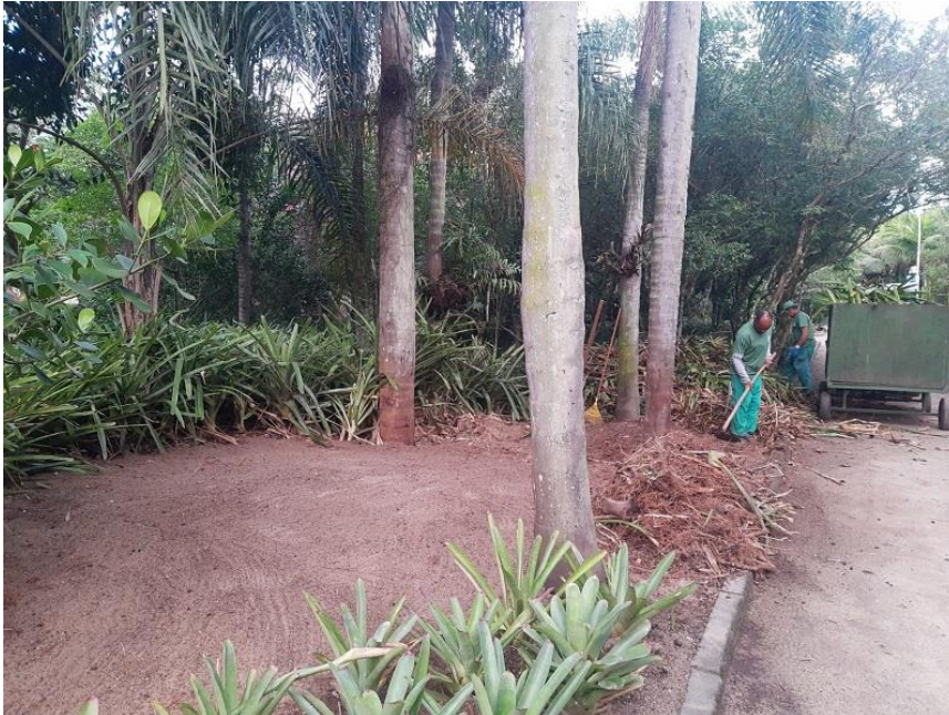
Funcionário realizando limpeza e remoção de plantas daninhas.