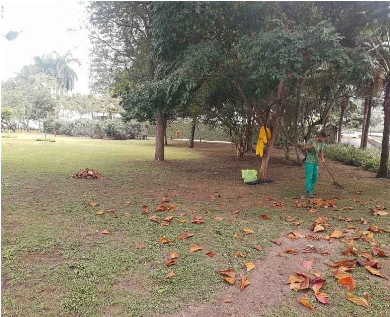
Varrição sendo realizada.