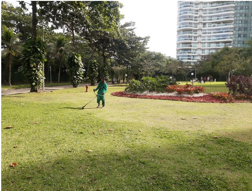
Operador de roçadeira realizando corte de grama.