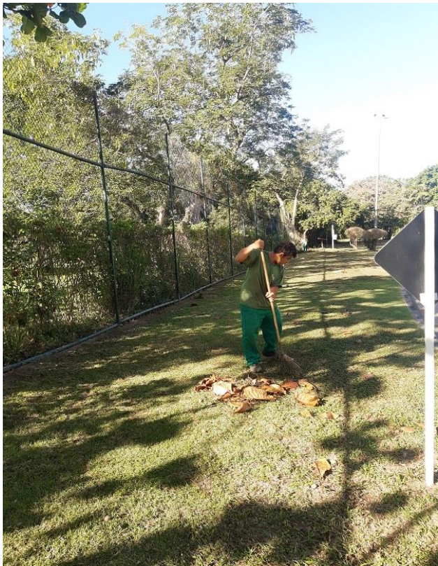
Varrição sendo realizada.