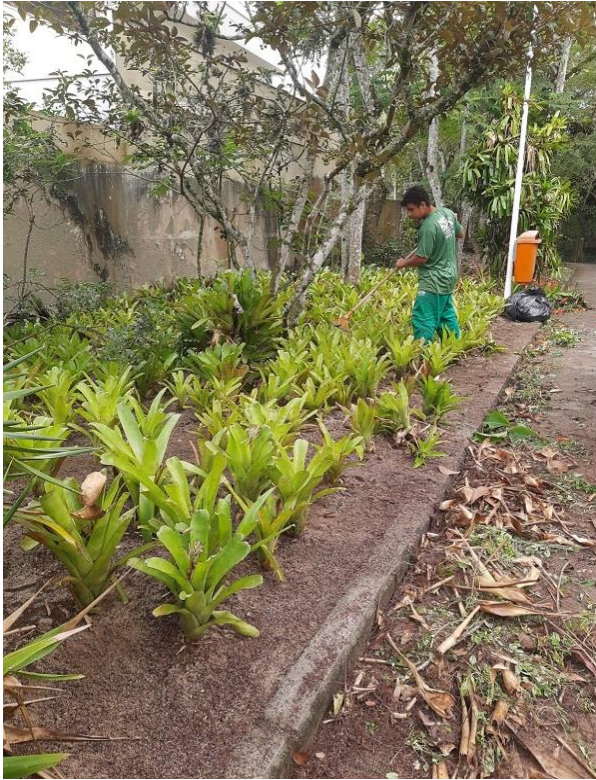
Funcionário realizando limpeza de folhas secas em canteiro de Bromélias.