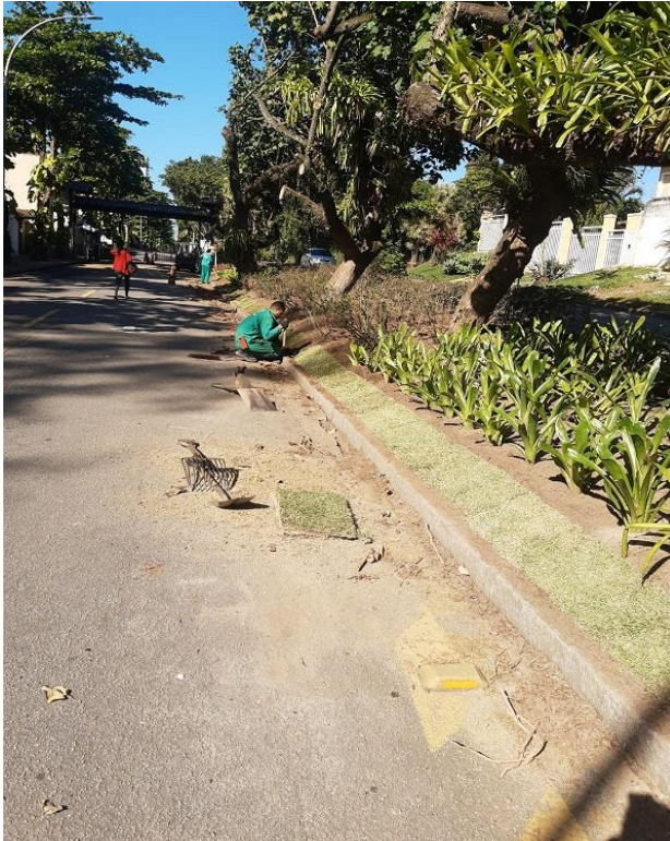
Funcionário realizando plantio de grama.