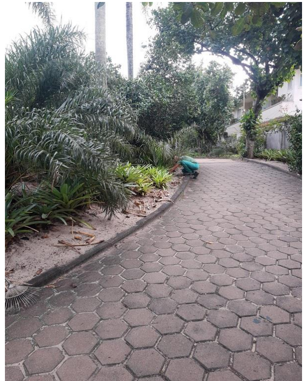
Funcionário realizando limpeza de folhas secas em canteiro de Bromélias.