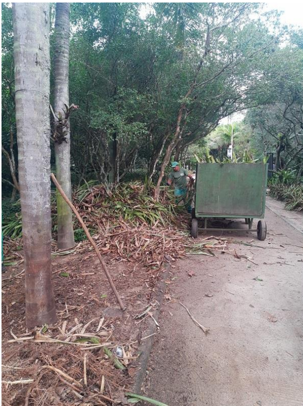
Funcionário realizando limpeza e remoção dos restos vegetais.