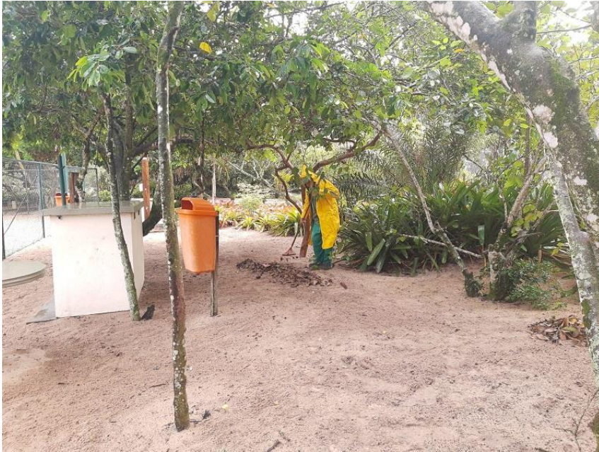
Funcionário realizando varrição dos restos vegetais.