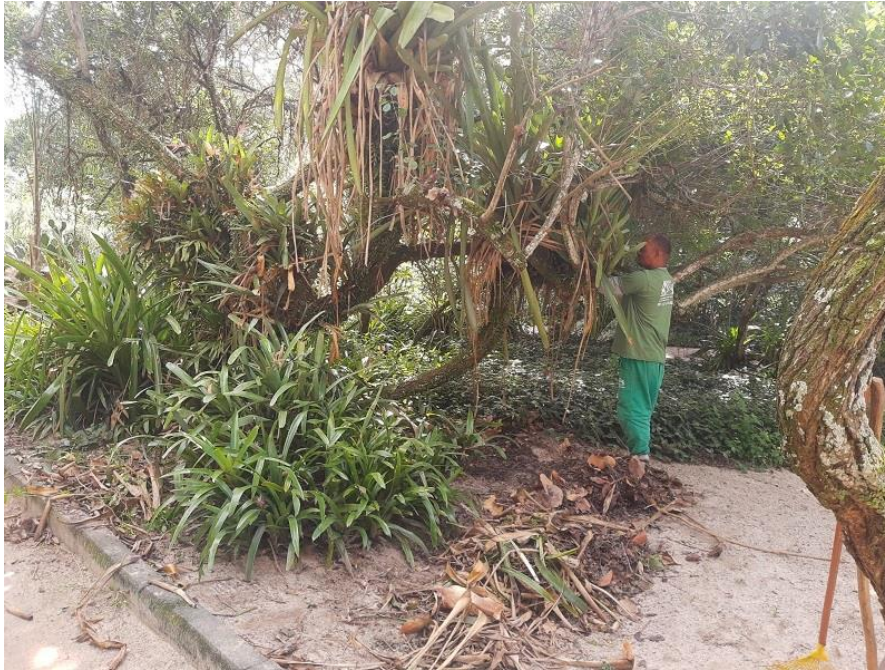
Limpeza de folhas secas sendo realizada.