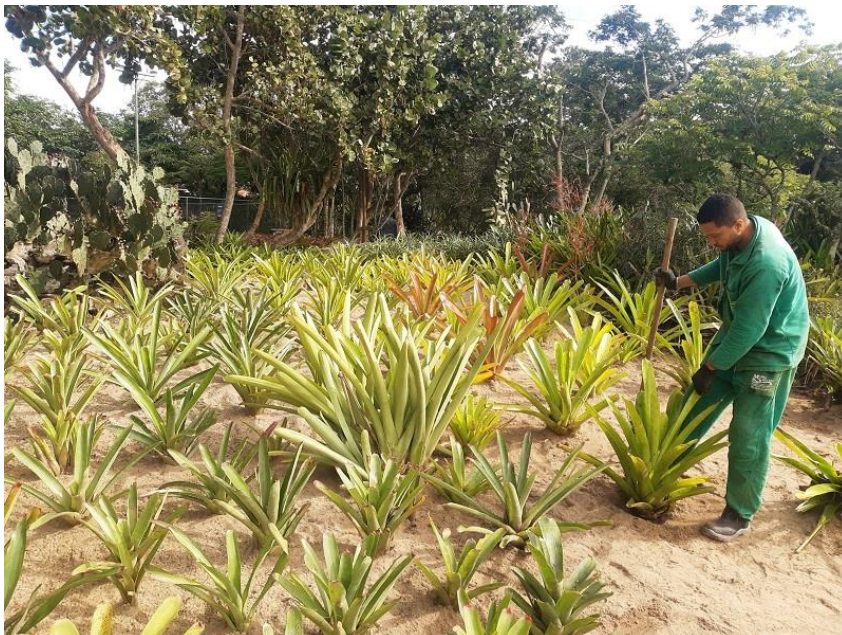
Funcionário realizando replantio de Bromélias.