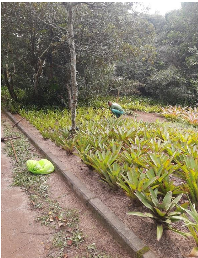
Monda (Remoção de Plantas Daninhas) em canteiro de Bromélias.