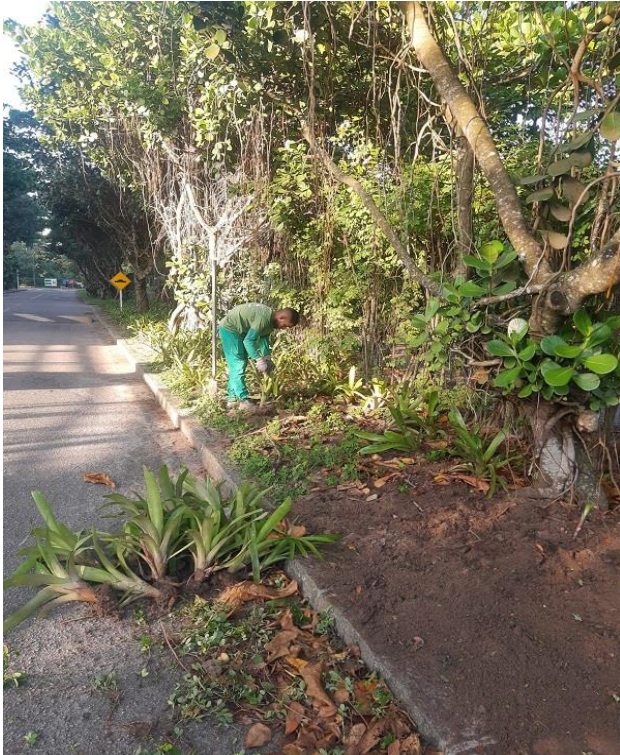
Funcionário realizando limpeza e reforma de canteiros.