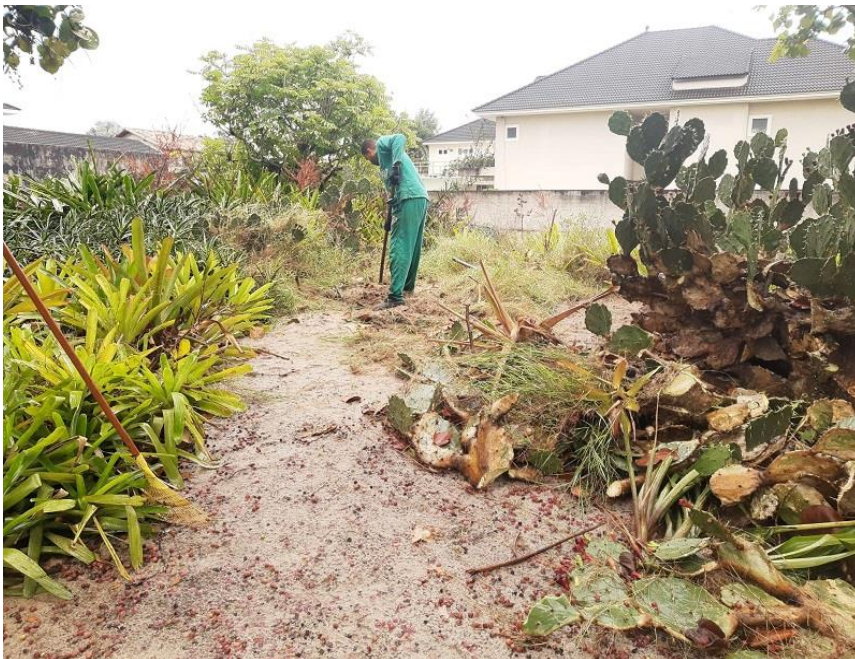
Capina sendo realizada para remoção de Plantas invasoras indesejáveis.