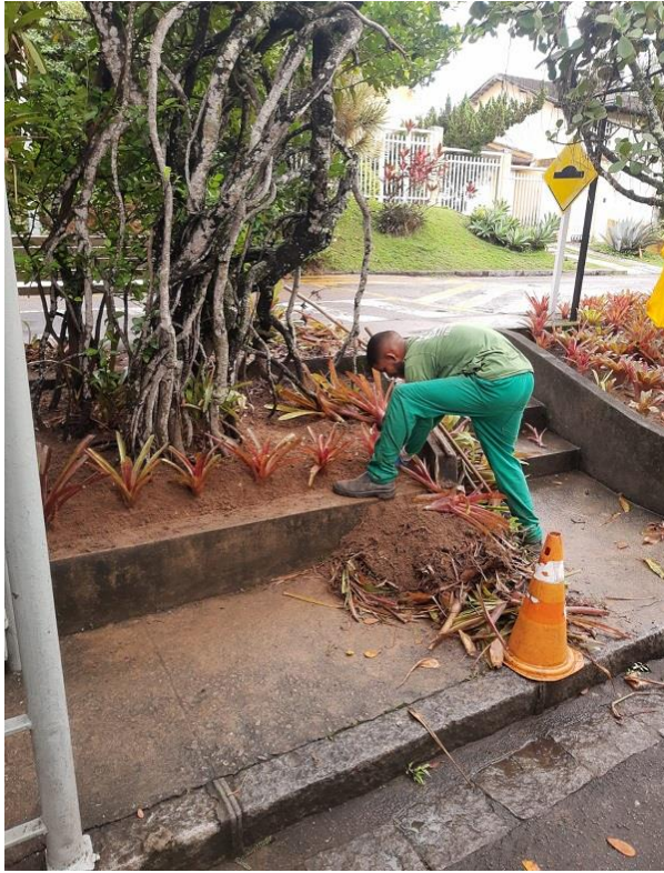
Funcionário realizando replantio de bromélias.