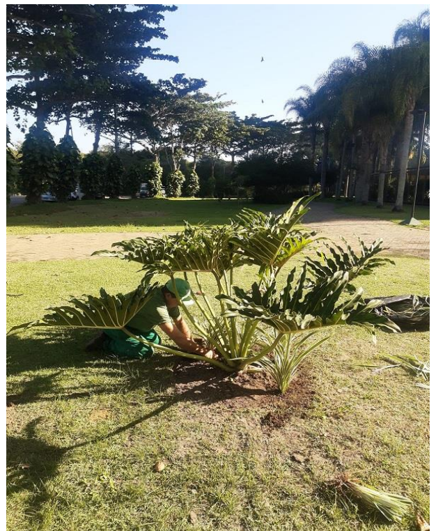
Funcionário realizando plantio de Dionela ( Dianella tasmanica ).