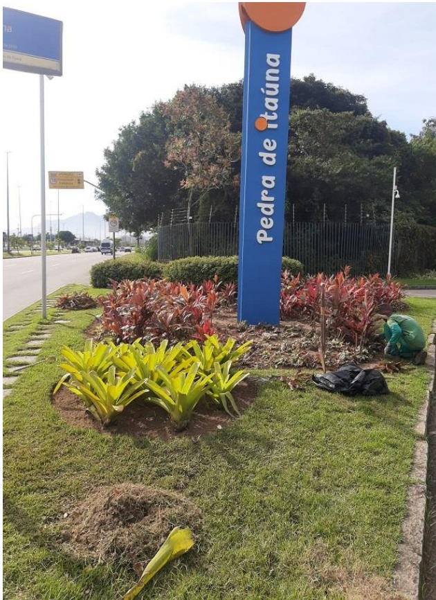
Funcionário realizando limpeza em canteiros.