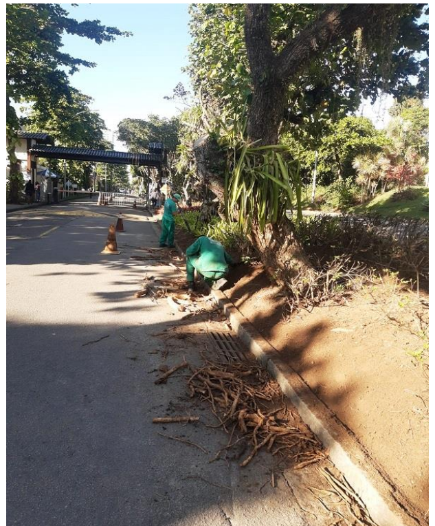
Limpeza sendo realizada.