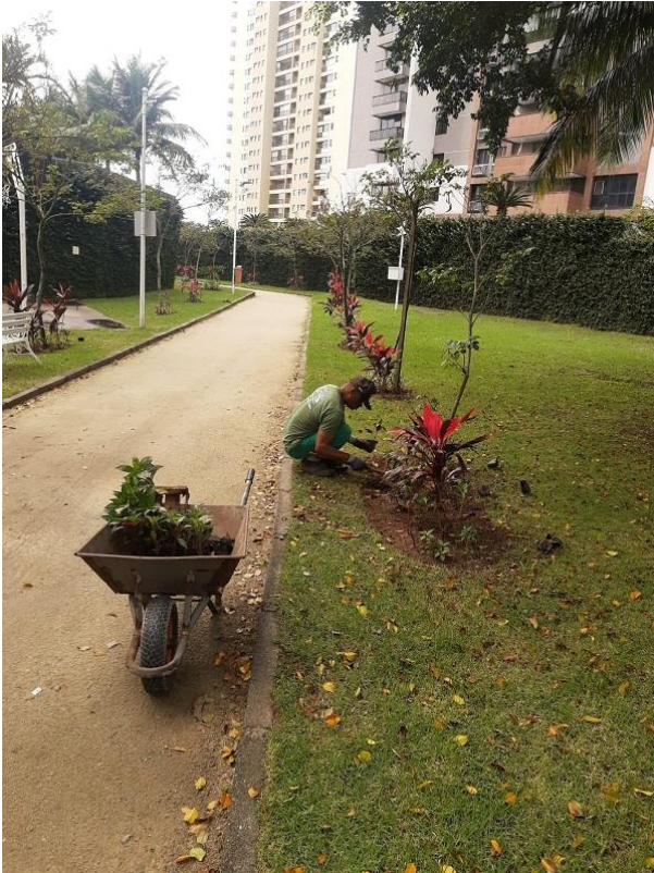
Funcionário realizando replantio de espécies vegetais.