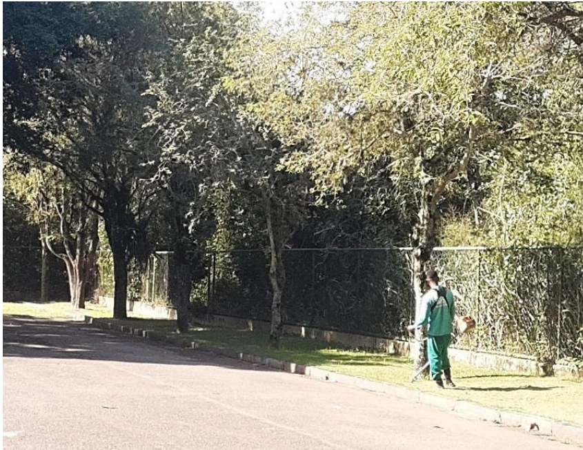
Operador de roçadeira realizando corte de grama.