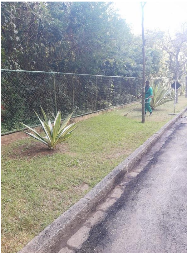
Operador de roçadeira realizando corte de grama.