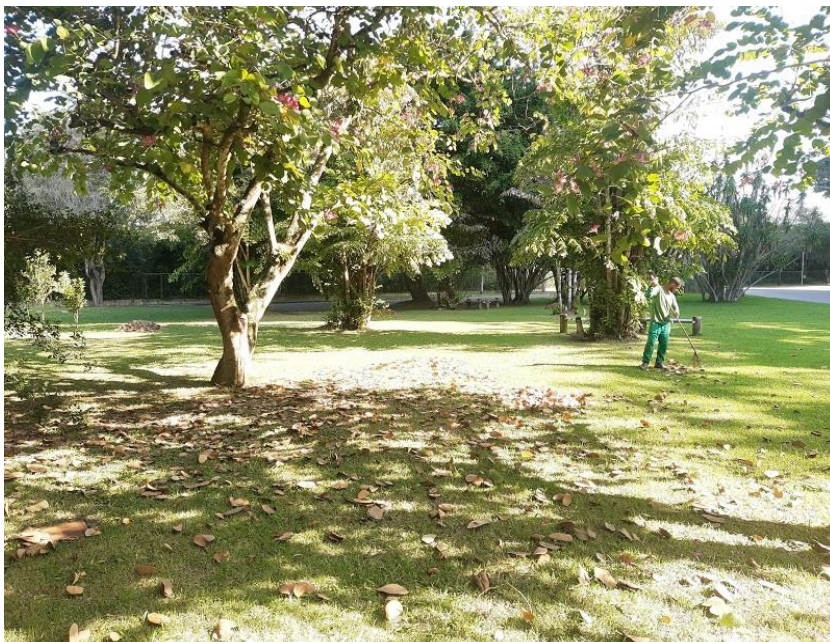
Varrição sendo realizada.